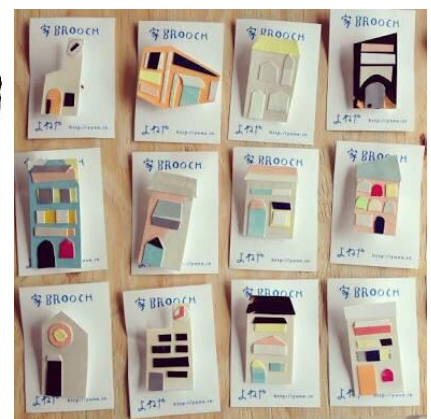
※イメージ写真です。