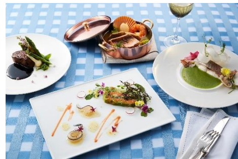
牧原 秀樹氏 料理イメージ