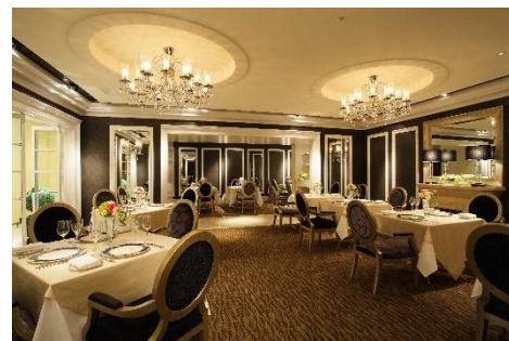
ホテル日航大阪 フランス料理「レ・セブリティ」